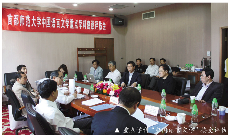
▲重点学科“中国语言文学”接受评估