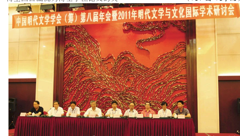
▲学院承办2011年明代文学与文化国际学术研讨会