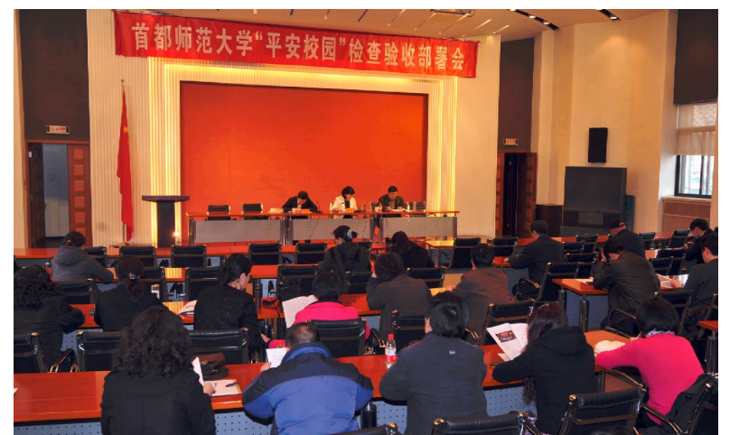
△2012年3月27日,学校召开“平安校园”创建检查验收工作部署会

是对师生员工加强“平安校园”创建宣传工作。三是做好自查和校内预验收工作。四是做好四个座谈会筹备工作。五是做好实地察看和现场演练准备工作。六是扎实做好学校当前的安全稳定日常工作。张雪书记要求各院(系)、单位要深入研究,积极准备;同时责成相关部门按照既定任务分解和工作分工,抓好具体工作落实,确保验收顺利进行和校园安全稳定。