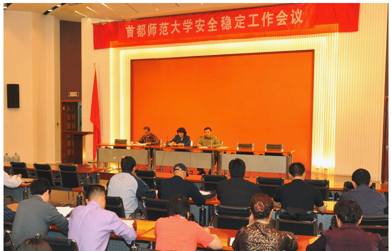
△2011年9月,学校召开新学期安全稳定工作会议,明确提出在我校开展“平安校园”创建工作。

2011年9月,学校召开新学期安全稳定工作会议,明确提出在我校开展“平安校园”创建工作。