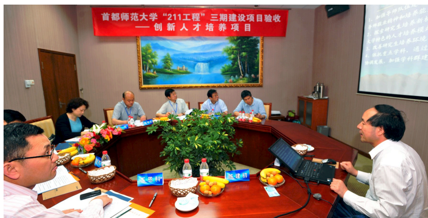
全国百篇优秀博士学位论文

博士生成为我校科研力量的重要组成部分,大多数博士研究生积极参与国家863项目、国家973项目、国家自然科学基金、国家社科基金、教育部项目等省部级以上的重点科研项目。博士生在国内外高水平刊物上发表的论文数量稳步增加,论文质量逐步提高。2007-2011年间,我校博士生共发表论文2195篇,其中国内核心期刊论文903篇,SSCI 176篇,CSSCI 212篇,SCI 214篇,EI 54篇。此外,博士生独立出版著作24部,参与出版著作189部。