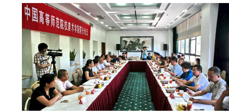
开拓创新 提高核心竞争力 坚持特色 带动学院大发展(上接1版)

“十二五”期间,音乐学院将以培养中青年学科带头人、骨干教师为重点,加大引进,立足培养,优化各类结构,营造聚集人才和促进人才成长的良好环境,建设一支师德高尚、结构优良、富有创新活力、适应首都及全国音乐教师教育和文化艺术事业需要的高质量的教师队伍。“十二五”期间,引进5名左右在国内外音乐舞蹈界有学术影响力的学科带头人,引进5名左右在国内外音乐理论、音乐教育研究方面具有影响并具有博士学位的优秀专业教师;围绕音乐、舞蹈以艺术实践与表演为主的专业,引进10名左右国际或国内获奖的高水平专业教师。同时,要结合学科和专业发展目标,重点加强器乐、舞蹈、音乐科技与音乐理论专业青年教师的培养,采取多种形式进行资助,鼓励他们在学术上不断追求,支持他们在学术上更加精进。促进中青年教师不断成熟,成为音乐学院建设的重要力量。