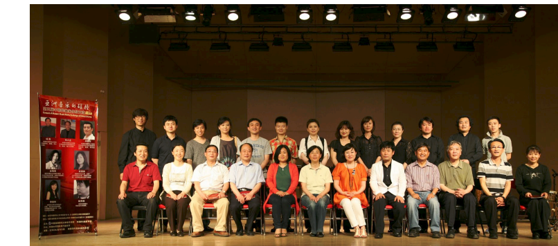
抓好学科建设人才培养队伍 建设中国一流的音乐学院(上接1版)

我到首都师范大学挂职学习已一年有余。在这段时光里,感受到来自学校领导老师的关怀与关爱。这种关爱给予我和学员们无限的温暖和奋斗的力量!我常常反思:人生最大的快乐和幸福是什么?我终于在首都大,在学员那饱含深情的“雪妈妈”的呼唤中找到了答案:是付出,是奉献,是博爱…… 我从河南农村走进边疆军营,又从军营走进塔克拉玛干沙漠深处那片充满神奇绿洲——和田。回想起在首都的怀抱里徜徉,得到滋养;我庆幸能和具有时代精神的家乡学员共同进步成长,他们的行动让我看到了和田的未来;我庆幸能得到诸多恩师无私的指点、呵护与关爱。