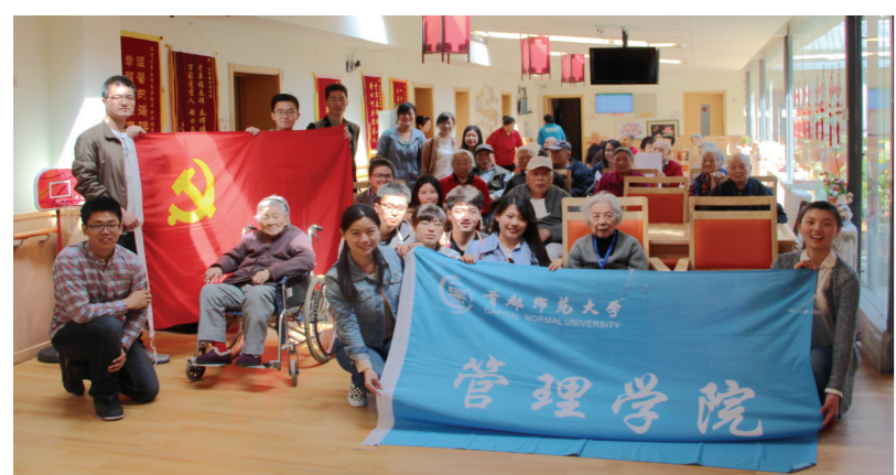
学生党支部在草厂胡同养老院开展党日活动