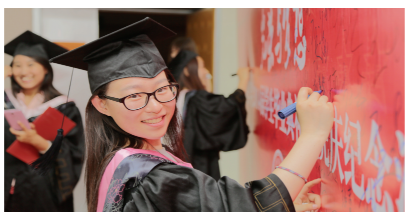
“光荣与梦想”毕业生纪念活动