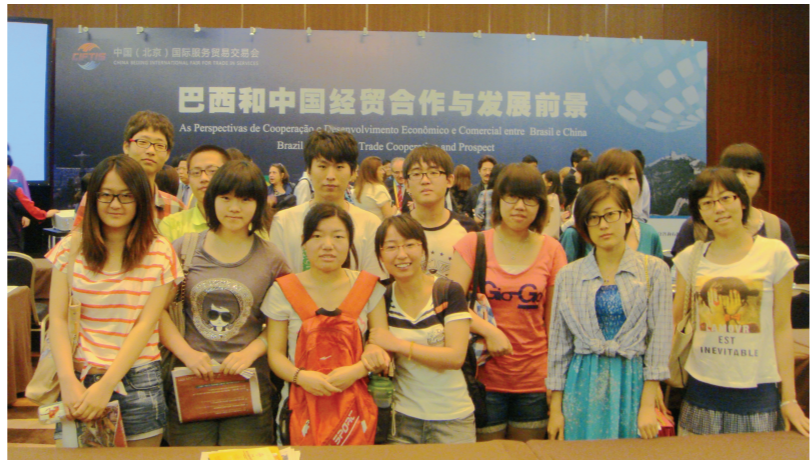
学生参加中巴贸易展销会