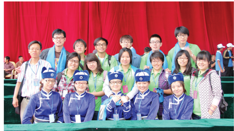
学生参与内蒙古锡林郭勒盟正蓝旗那达慕大会志愿服务