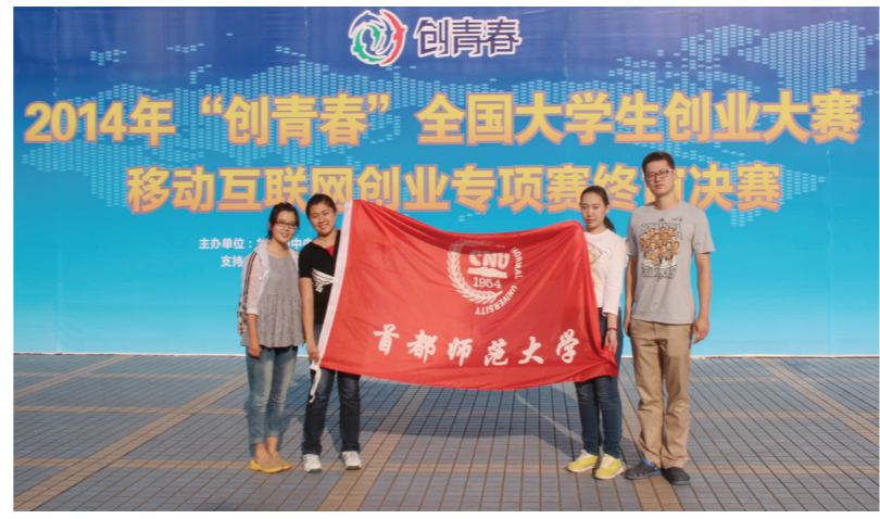
学生团队获得2014年“创青春”全国大学生创业大赛银奖