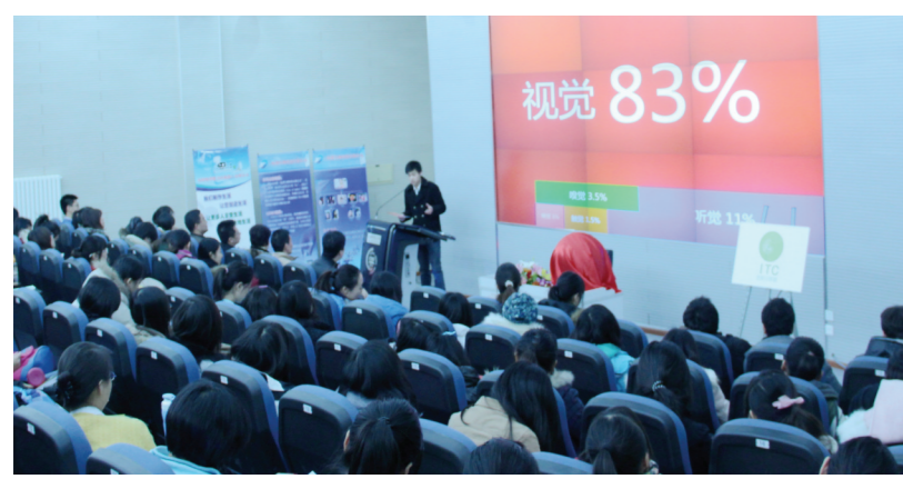
管理学院组织创业计划书分享会