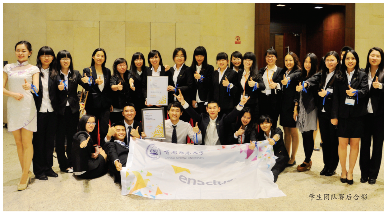
学生团队赛后合影