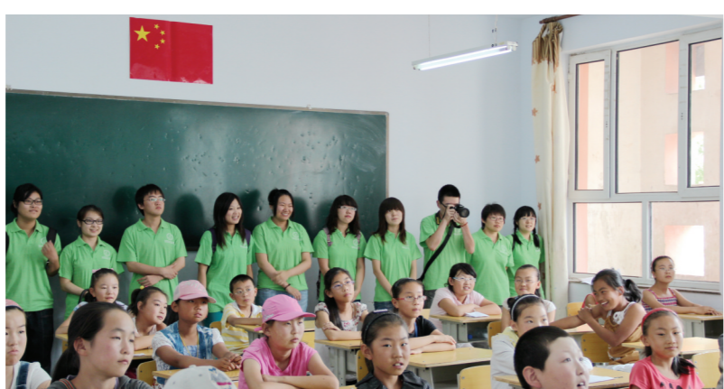
学院组织暑期义务支教活动