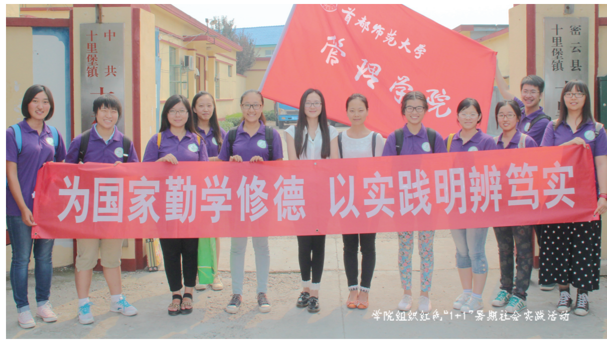
学院组织红角“1+1”暑期社会实践活动